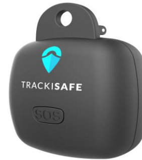
Caja de sujección