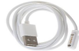
Cable de carga magnética